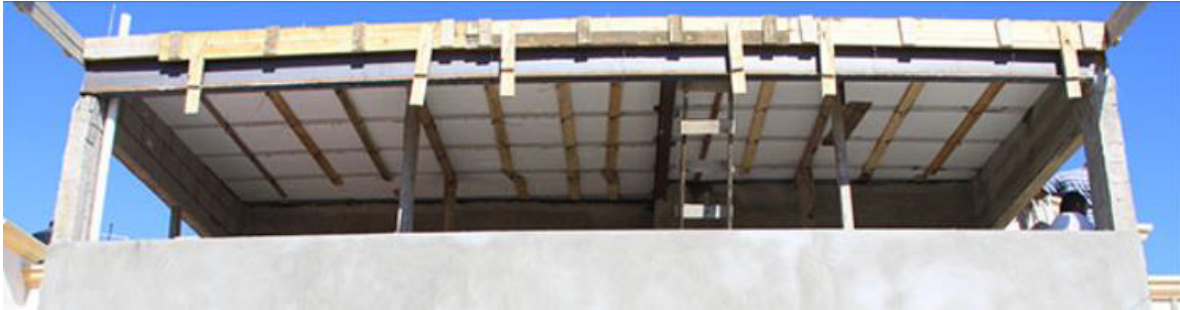
Figura 2: Ejemplo de utilización práctica.

La colocación de estas fajillas se realiza después de colocados los puntales y antes de las bovedillas. Como es un apoyo temporal, las fajillas pueden utilizarse en la construcción de otras losas posteriormente.